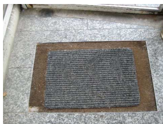
Kunst am Bau

Anstatt das Wasserproblem in der Dachkonstruktion baulich zu lösen, wird einmal jährlich durch das Entfernen von Laub und Ästen vorübergehend Linderung geschaffen. Selbst dies wird nicht regelmäßig von der Bauverein AG selbst veranlasst, sondern muss von den Mietern durch telefonische Beschwerde angemahnt werden.